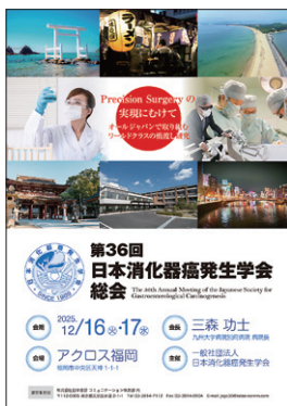
第36回日本消化器癌発生学会ポスター