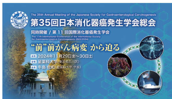
第35回日本消化器癌発生学会総会 タイトル